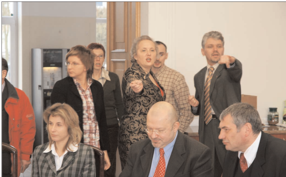
Spotkanie w Sztumie cieszyło się ogromnym zainteresowaniem i stworzyło możliwość podjęcia szerokiej i żywej dyskusji.